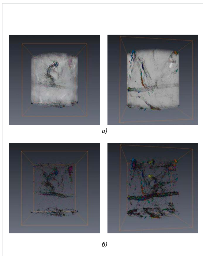
Рис. 4 — Томограммы порового пространства образца № 11771-12: а) до фильтрации; б) после фильтрации химического состава №6 Fig. 4 — Sample 11771-12 Void Space Tomograms: а) before filtering; б) after filtering of chemical agent No.6