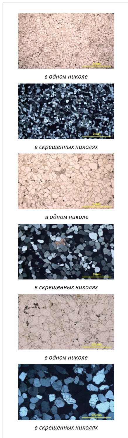
Рис. 2 — Фото шлифов образца № 11 Fig. 2 — Sample 11 Thin Section Photo

терригенный коллектор, минералогический состав, рентгенографический анализ, глинистая составляющая, бесфторные составы