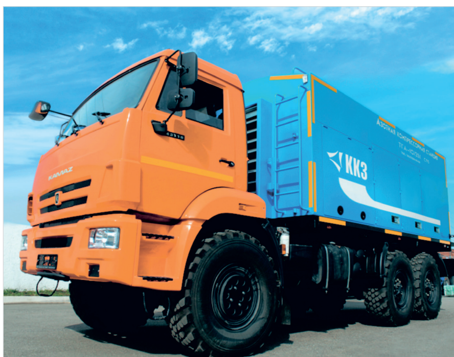
Рис. 3. Инновационная азотная станция модели ТГА-10/251

На сегодняшний день самой востребованной в нефтедобыче является инновационная азотная станция модели ТГА-10/251 с концентрацией азота на выходе 95 % (рис. 3).