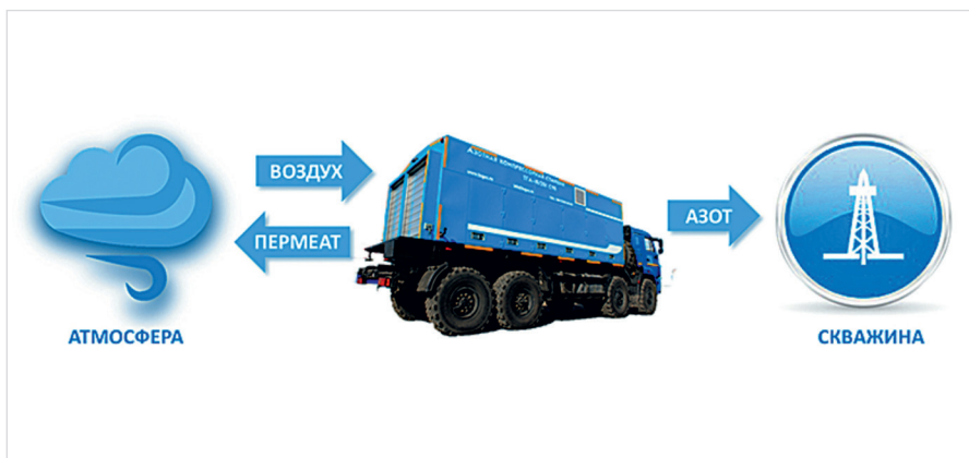
Рис. 2. Схема процесса получения газообразного азота из воздуха

Газообразный азот применяется также при выполнении таких операций, как капитальный ремонт скважин, опрессовка скважин, бурение на депрессии, освоение скважин после ГРП, консервация и расконсервация скважин и др. Оптимальное мобильное решение задачи получения газообразного азота из атмосферного воздуха непосредственно на нефтяных скважинах и других объектах, требующих подачи азота высокого давления, — азотные станции серии ТГА. Передвижная азотная компрессорная станция доставляется к объекту и запускается в работу (рис. 2).