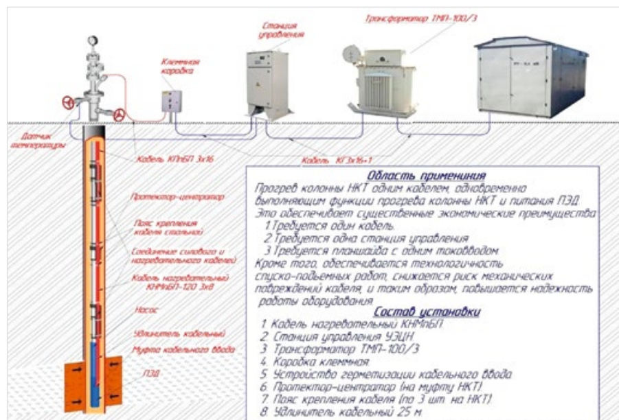
Рис. 1 — Общий вид УПС

В общем случае кабельная линия состоит из трёх отводов, соединённых сращками в соответствии со специальным технологическим процессом. Верхний холодный отвод, выполненный из кабеля КППБП-120 3х10(16,25) проводят из затрубного пространства скважины через герметичный кабельный ввод и соединяют с источником питания и станцией управления УЭЦН, с другой (нижней) стороны его сращивают с греющим отводом, изготовленным из кабеля КНМППБП, который подключается к погружному двигателю посредством кабельного удлинителя с муфтой. Монтаж УПС проводится на колонне НКТ в обычном порядке.