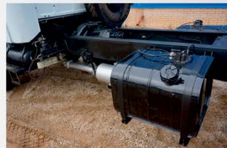
Топливные баки и детали выхлопной системы перенесены для установки аутригеров