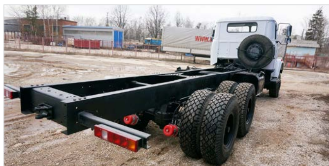
Длиннобазное шасси позволяет монтировать различные надстройки

* — размер при полной массе; ** — размеры в снаряженном состоянии