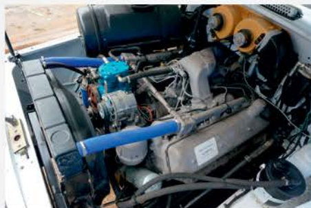
Шасси комплектуется силовым агрегатом ЯМЗ-238 Евро-0