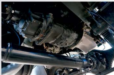
Для шасси разработана карданная передача оригинальной конструкции