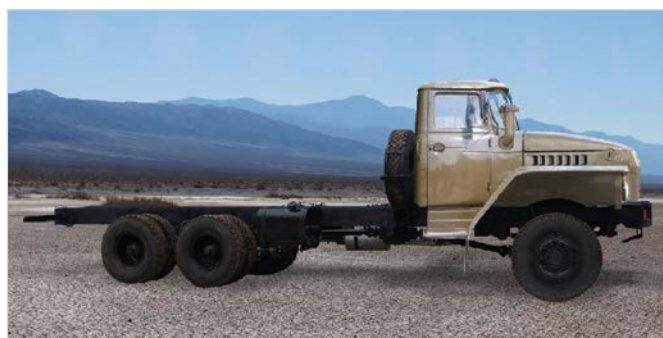
Вариант исполнения шасси с кабиной Урал